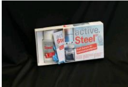
active.steel® Standard Box