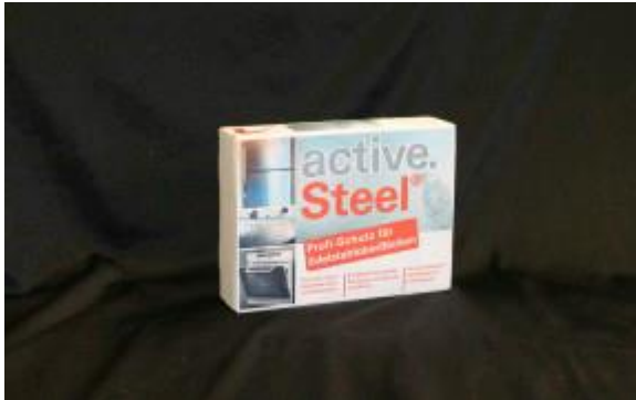
active.steel® Standard Box